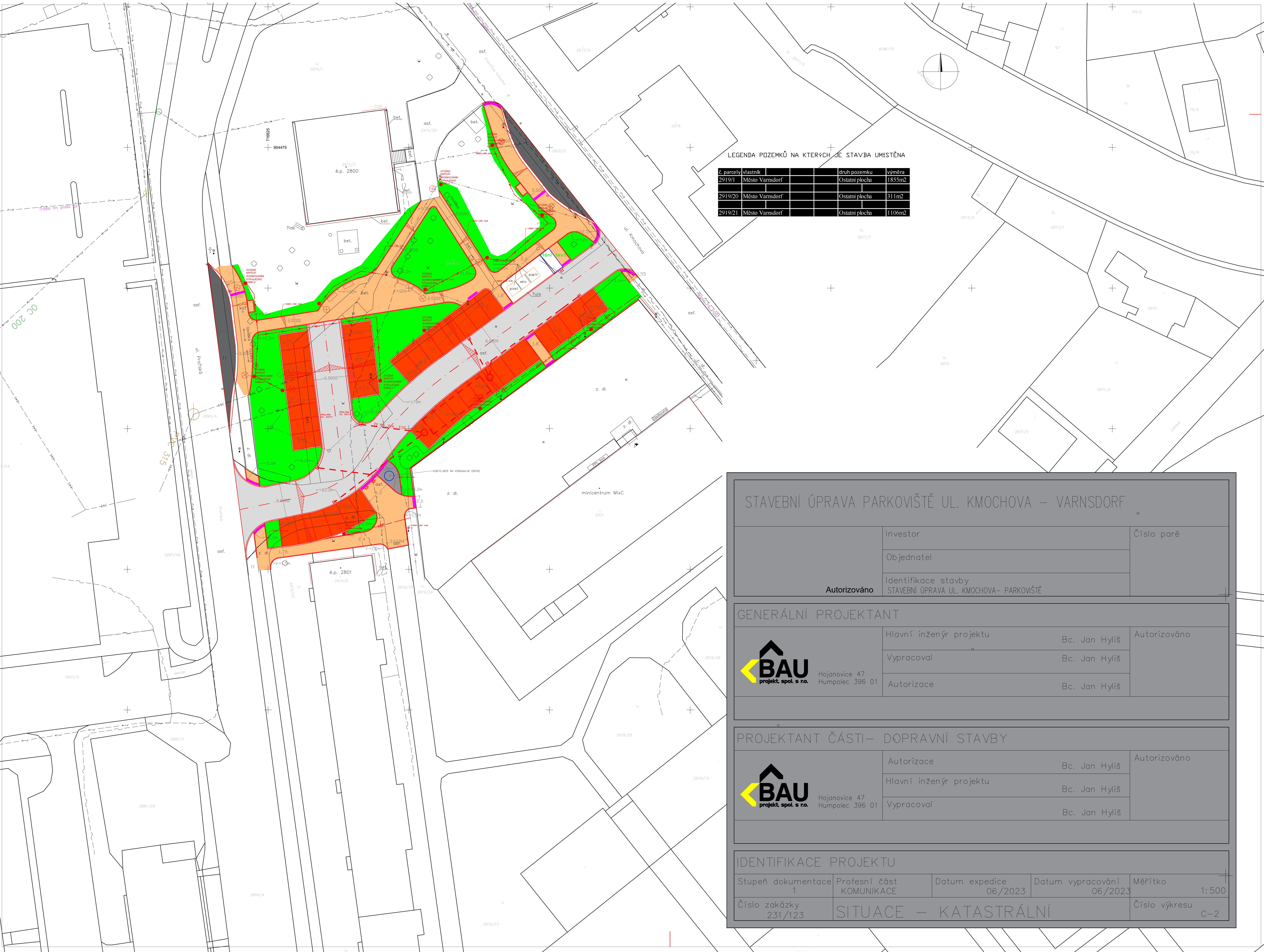
LEGENDA POZEMKŮ NA KTERÝCH JE STAVBA UMÍSTĚNA